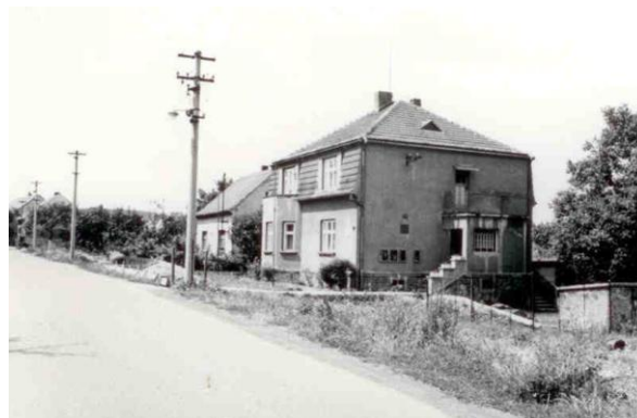
Mateřská školka – 80. léta 20 století