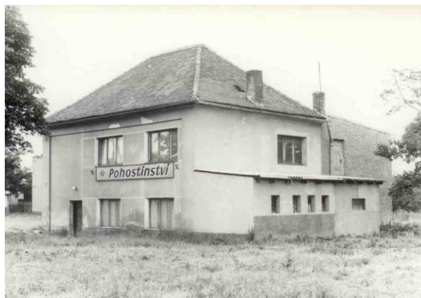
Bývalá budova kulturního domu