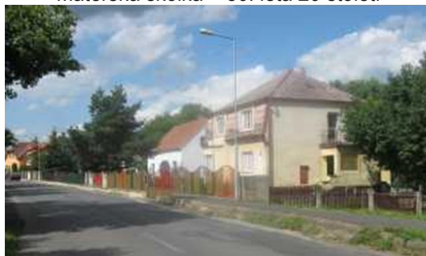
Mateřská školka v roce 2011